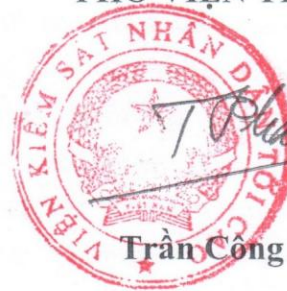
Trần Công Phàn